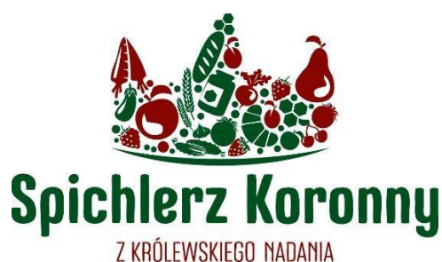
Rysunek 5: Logotyp Marki Lokalnej Spichlerz Koronny

Bardzo ważne z punktu widzenia rozwoju produktów lokalnych jest wprowadzona w 2018r. Marka Lokalna „Spichlerz Koronny”. Marka ta ma przypisany odpowiednio prowadzony proces certyfikacji, dzięki któremu znak marki otrzymują lokalne produkty najwyższej jakości. Po czterech edycjach naboru wniosków w skład grona wyróżnionych Znakiem Marki „Spichlerz Koronny” wchodzi: 23 podmioty, a wraz z nimi w portfolio Marki znajduje się ponad 30 produktów spożywczych, 7 produktów użytkowych, 4 produkty rękodzielnicze, 3 usługi i jedno lokalne wydarzenie. Marka ta staje się coraz bardziej rozpoznawalna wśród klientów, gdyż producenci wprowadzają oznakowanie produktów logo Marki i w trakcie sprzedaży eksponują statuetki Marki. Jednak aby realne rozpoznawanie produktów certyfikowanych, a tym samym realny wpływ Marki „Spichlerz Koronny” na wybory zakupowe klientów były zdecydowanie większe LGD musi ponieść nakłady na odpowiednią promocję i wsparcie rozwoju Marki, dlatego niniejsza LSR przewiduje dedykowane Marce „Spichlerz Koronny” przedsięwzięcie, w ramach którego zostaną sfinansowane nie tylko materialne narzędzie promocyjne, ale także powstaną materiały do promocji w prasie, telewizji i internecie, co z pewnością realnie zwiększy rozpoznawalność tego znaku jakości.