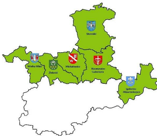
Rysunek 1: Mapa obszaru objętego LSR

Poniżej, na rysunku 1 przedstawiona jest mapa wykazująca spójność przestrzenną obszaru objętego LSR z zaznaczeniem granic poszczególnych gmin wchodzących w skład LGD.